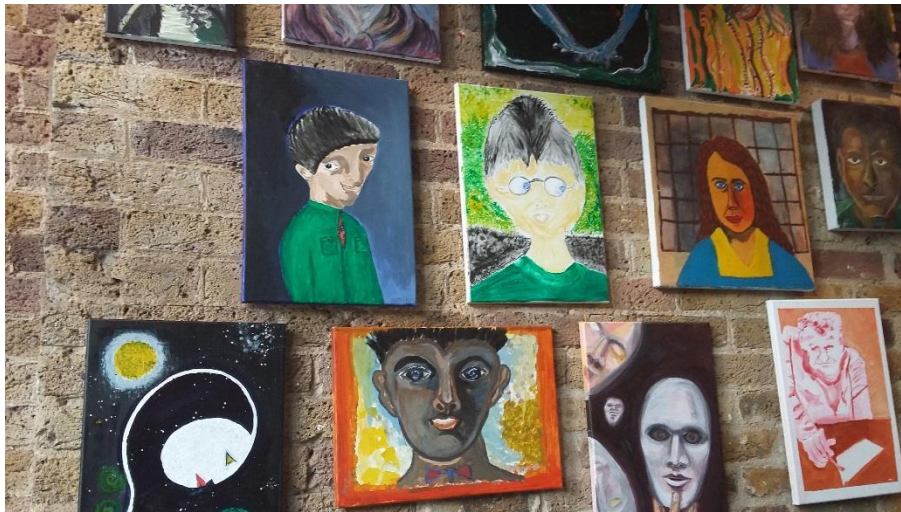
Taidekurssilaisten teoksia lounaskahviossa.

Crisis järjestää asuntoja yksityiseltä sektorilta ns. Private rented sector access service -palvelun avulla. Crisis etsii asuntoja ja vuokranantajia, asukas tekee itse vuokrasopimuksen suoraan vuokranantajan kanssa. Tavoitteena on taloudellisten, rakenteellisten ja henkilökohtaisten esteiden ylittäminen, jotta asunnon saaminen onnistuisi. Asunnon löydyttyä sen soveltuvuutta arvioidaan asunnon tarvitsijan kanssa. Hakija saa asumisvalmennuksen sekä apua asunnon katsomisessa, vuokrasopimuksen teossa, asumaan asettumisessa (mm. kalustus), sekä jatkuvaa monipuolista tukea. Asukkaan puolesta asioita ei kuitenkaan tehdä. Kuten meilläkin mielekäs tekeminen on todella tärkeä osa jatkuvaa tukea. Crisis Skylight -päiväkeskuksissa on paljon tekemistä ja kursseja tarjolla.