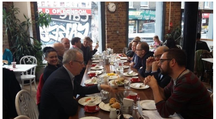
Opintomatkalaiset Crisis-järjestön Skylight-keskuksen lounaskahviossa.

Crisis -järjestö on liki parinkymmenen vuoden ajan kehittänyt toimintamallia yksityisen vuokra-asuntokannan hyödyntämiseksi asunnottomuustyössä. Yhteistyössä Yorkin yliopiston kanssa se on myös julkaissut aiheesta oppaan. Yksi vuonna 2014 toteutetun Suomen asunnottomuusohjelman kansainvälisen tutkija-arvioinnin suosituksista oli yksityisen vuokra-asuntokannan lisääminen asunnottomuustyössä. Siihen etsitään parhaillaan toimintamallia yhteistyössä kuntien ja järjestöjen kanssa ja tutustumiskäynniltä toivotaan eväitä ja kokemustietoa tähän työhön. Toinen meille tärkeä ajankohtainen teema on arjen mielekkään toiminnan sekä työelämäpolkujen kehittäminen asunnottomuutta kokeneille. Järjestön tunnustusta saaneet Crisis Skylight keskuksset tarjoavat asunnottomille koulutusta, harjoittelumahdollisuuksia sekä työllisyyttä ja itsenäistä elämää tukevia toiminnallisia sisältöjä. Crisis Skylight -työstä haetaan oppia asunnottomille suunnatun koulutuksen ja työelämätaitoja kehittävien toiminnallisten sisältöjen tueksi. Tämä on ajankohtainen haaste myös entisille asunnottomille palveluja kehittäville järjestöille.